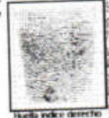
Huella índice derecho