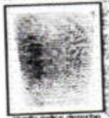
Huella índice derecho

y manifestaron que el anterior documento es cierto y verdadero y que las firmas y las huellas que aparecen son suyas.